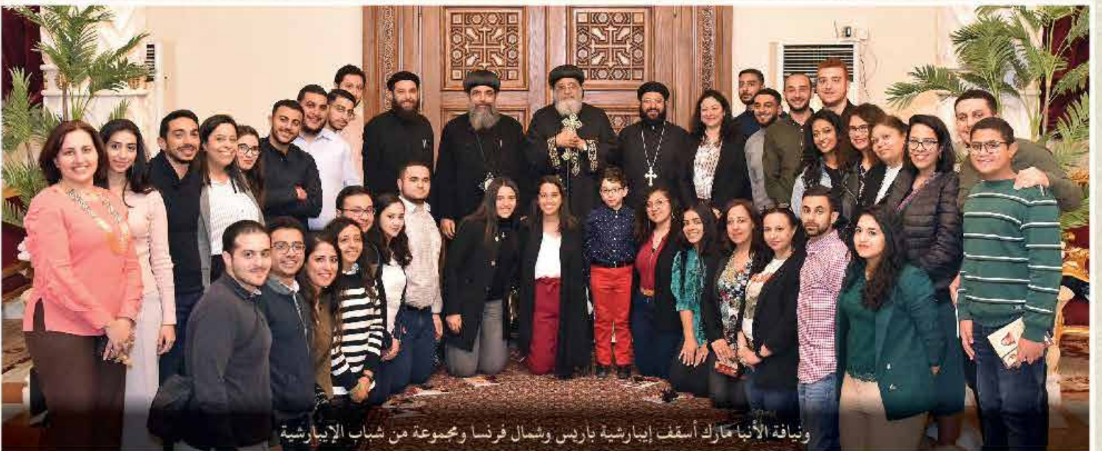
ويناظرة الأنبا مارك أسقف إبارشية باريس وشمال فرنسا ومجموعة من شباب الإبارشية